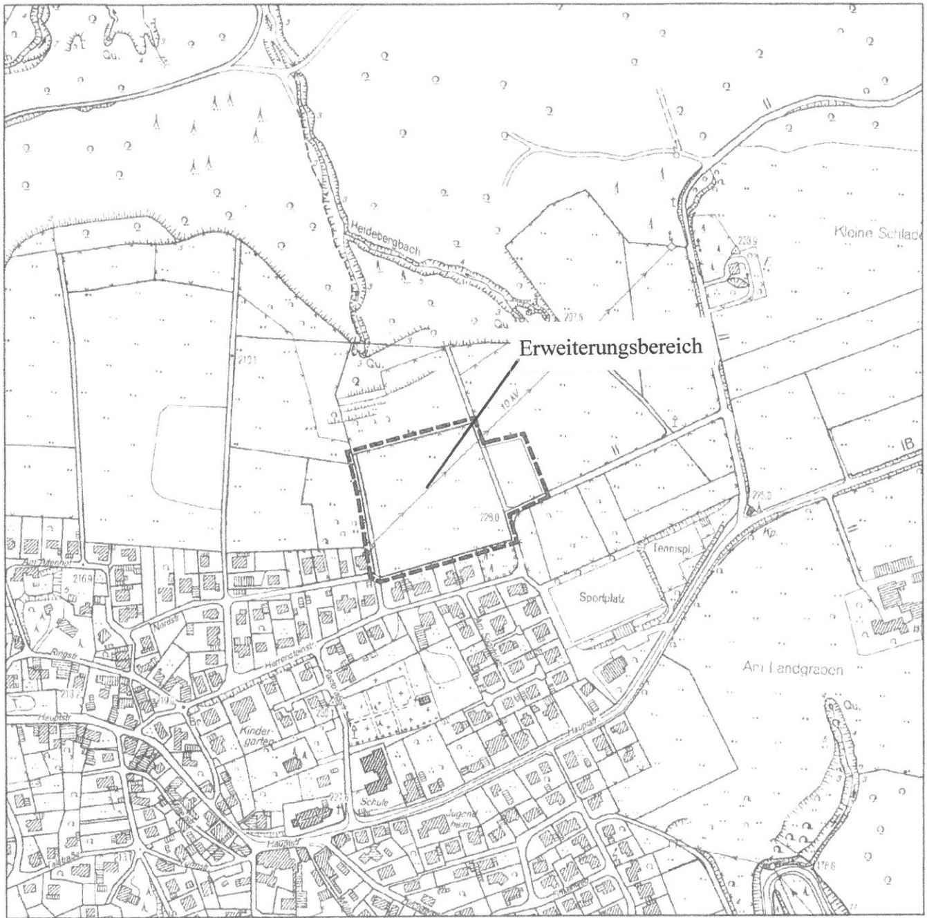
Geltungsbereich der 1. Erweiterung des Bebauungsplanes Nr. 3.01 Winterscheid-Ortslage nördlich der Herrnsteinstraße